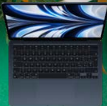
APPLE MACBOOK AIR M2 - SSD 512GB