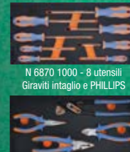
N 6870 1000 - 8 utensili Giraviti intaglio e PHILLIPS