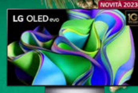
LG TV 55" OLED 4K