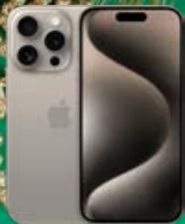
APPLE IPHONE 15 PRO - 256GB