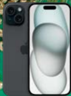
APPLE IPHONE 15 128GB