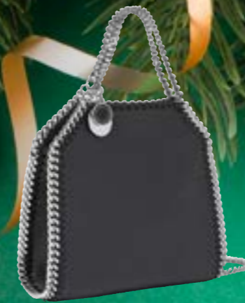
STELLA MCCARTNEY BORSA TOTE