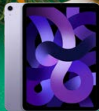
APPLE IPAD AIR WI-FI 256GB