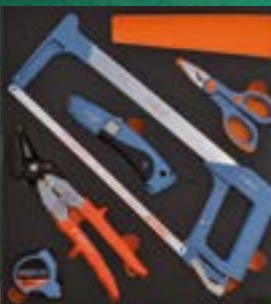
N 6870 1500 - 5 utensili Utensili da taglio