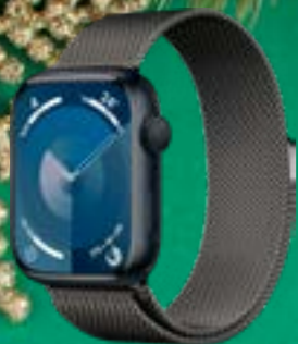
APPLE WATCH 9 GPS