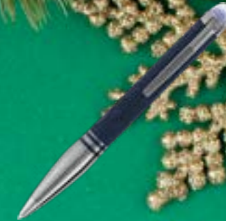
MONTBLANC STARWALKER SPACEBLUE DOUÉ