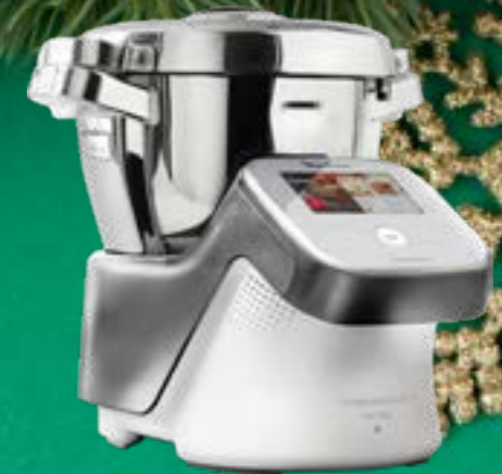
MOULINEX ROBOT DA CUCINA I-COMPANION