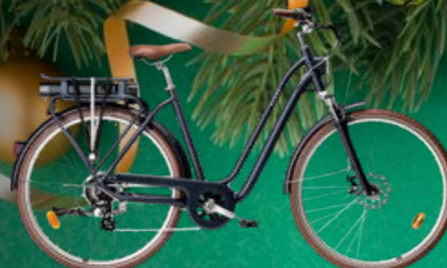
ELOPS 900 BICI A PEDALATA ASSISTITA