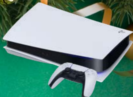
SONY PLAYSTATION 5 DISC C