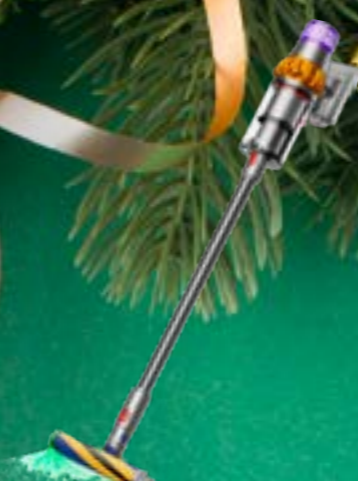
DYSON V15 DETECT